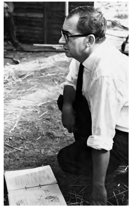
José Luis Borau en una imagen tomada durante el rodaje de Brandy , 1964.