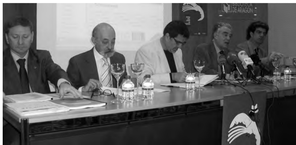
Acto de presentación de la Feria del Libro de Zaragoza en la Biblioteca de Aragón.

Las hojas de los libros pedirán permiso para ser protagonistas por unos días en el parque. Y junto a ellas, cuentacuentos, gymkhanas en busca de libros perdi-