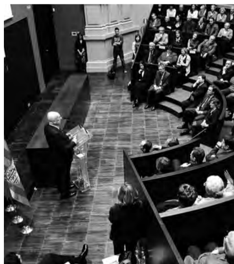
Distintos momentos del día de entrega del Premio de las Letras Aragonesas.

El Jurado acordó otorgar el Premio de las Letras Aragonesas 2009 a José Luis Borau, por "su compromiso intelectual con el lenguaje cinematográfico, su lucha por la renovación de la narrativa audiovisual; y por la asunción del valor literario de la escritura cinematográfica y por su admirable trabajo en el campo de la cuentística, con títulos fundamentales como Camisa de once varas ".