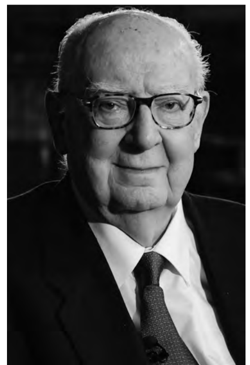
José Luis Borau el día que se le entregó el Premio de las Letras Aragonesas.

ras de Tata mía , Furtivos y Celia . Un clarinetista interpretó para sorpresa del escritor la jota que Imperio Argentina cantara también en la película Tata mía . En la antesala del Aula Magna se podía visitar una exposición que recorría la obra del director. A través de la web www.centrodellibrodearagon.es se accedía al blog de las Noches de Libros Abiertos 2010 , en donde se podía disfrutar de toda esta información y en el que todavía hoy se pueden ver diferentes vídeos del acto.